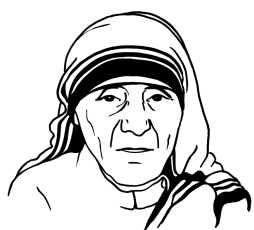
S. TERESA DI CALCUTTA

"Non è tanto quello che facciamo, ma quanto amore mettiamo nel farlo. Non è tanto quello che diamo, ma quanto amore mettiamo nel dare."