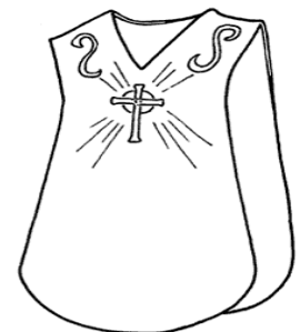
Veste bianca del Battesimo